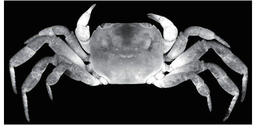
Fig. 2. Epigrapsus politus (RUMF-ZC-7169, female, 10.5 × 8.7 mm, Okinawa Island).

備考 検討標本は, 次の特徴を持つことによってアシナガアカイソガニと同定された (Sakai,