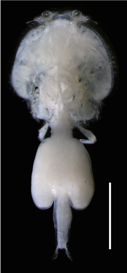
Fig. 1. Caligus bonito , female (dorsal view), NSMT-Cr 25876, from the inner surface of the operculum of Katsuwonus pelamis caught in the East China Sea off the Goto Islands, Nagasaki Prefecture, Kyushu, Japan. Scale bar: 2 mm.