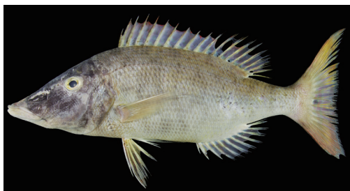
Fig. 2. Fresh specimen of Lethrinus microdon . KAUM-I. 110118, 303.4 mm standard length, Tanega-shima island, Osumi Islands, Japan.

皮下に埋没し、外部からは見えない。主鰓蓋骨後縁、前鰓蓋骨の後縁と下縁はいずれも円滑。体は剥がれにくい円鱗に被われる。前鰓蓋骨後縁よりも前方の頭部は、側頭部上方部に5–8枚の鱗があるのを除いて無鱗。背鰭前方鱗被鱗域の前縁は眼窩後縁に達しない。背鰭、臀鰭、腹鰭および胸鰭基底内側は無鱗。胸鰭基底外側と尾鰭基底は小鱗に被われる。頭部には感覚孔が密在する。両顎には1列に円錐歯が並び、その内側には小円錐歯が密生し、歯帯を形成する。側線は完全で、鰓蓋上方から尾柄にかけて、体背縁に並走する。