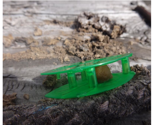
Fig. 3. Poisoned bait used for extermination.

鹿児島新港で発見されたコロニーが初期コロニーであったかどうかを推定するため、採集した働きアリ24個体の頭幅と触角柄節長を測定し、谷山港の成熟コロニーから採集した24個体のそれらと比較した（表1）。2か所のサンプルの平均値は、頭幅が0.65 mmと0.66 mm、柄節長がともに1.75 mmで、差は見られなかった。また、頭幅は Ito et al. (2016) がジャワ産の本種成熟コロニーから採集した働きアリのそれに近かった。これらのことから、鹿児島新港で発見された巣は、成熟コロニーの一部が船舶によって移動して来たもので、新たに独立創設されたものではないと推測された（独立創設の初期コロニーの働きアリはミニムと呼ばれ、通常の働きアリとは有意に小さいことが分かっている）。谷山港でみつかった有翅虫を生産していたコロニーは、侵入後成長して成熟したのか、あるいは成熟コロニーが運ばれて来たのか、判定できなかった。