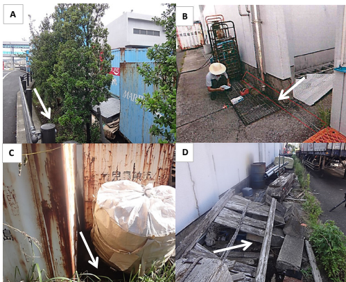
Fig. 2. Nest sites. A: New Kagoshima Port; B-D: Taniyama Port. Arrows indicate the entrance of the nests. Photo B: courtesy of the Department of Forestry, Kagoshima Prefecture.