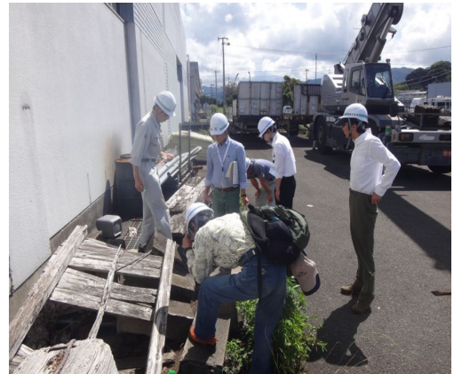
Fig. 4. Control work (Taniyama Port).