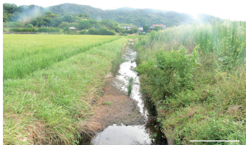
Fig. 1. Concrete-lined irrigation ditch where the freshwater fishes infected with Lernaea cyprinacea were collected at Kuroijinden-kami, Toyoura, Shimonoseki, Yamaguchi Prefecture, western Honshu, Japan. The water depth ranged from 3 to 39 cm. The photograph was taken on 10 August 2018. Scale bar: 1 m.

たまま、しものせき水族館海響館に運び、イカリムシ寄生魚を写真撮影した後、全個体を冷凍保存した。後日、この標本を静岡市にある水族寄生虫研究室に輸送して解凍し、1個体ずつ同定して標本体長を測定後、実体顕微鏡 (Olympus SZX10) を用いてイカリムシの有無を調べた。イカリムシが見られた場合は、寄生部位周辺の宿主筋肉をピンセットで注意深く除去して、イカリムシの体前部を取り出した後、体全体を70%エタノール液で固定・保存した。その後、これらを個別に実体顕微鏡下で観察してイカリムシであることを確認するとともに、実体顕微鏡に装着した写真装置を用いて撮影した。また、イカリムシのなかには体表に藻類が着生していた個体が見られたため、藻類の一部を採取し、生物顕微鏡 (Olympus BX51) でその形態、特に分枝の有無を調べた。現在、イカリムシ標本は第一著者のもとにあり、日本産イカリムシの形態学的研究を行った後に、茨城県つくば市にある国立科学博物館筑波研究施設の甲殻類コレクションに収蔵される予定である。イカリムシの寄生状況 (Table 1) を示す寄生率 (prevalence)、寄生強度 (intensity)、平均寄生強度 (mean intensity) の定義は Bush et al. (1997)、日本語訳は片平・川西 [2018] に従う。魚類の学名は中坊 (2013) に従う。