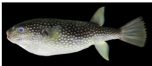
Fig. 1. Fresh specimen of Arothron firmamentum from off Gaja-jima island, Tokara Islands, Japan (KAUM-I. 96703, 141.6 mm SL, male).

める割合を百分率で記した。体側面はやや細長い楕円形を呈し、その断面は円い。各鰭の基部を除き体は小棘に被われる。体側に不明瞭な側線を有する。背鰭条数 14。臀鰭条数 14。胸鰭条数 16。鰓孔は小さい。鼻器の皮弁は二分する。両顎に左右 2 対（上下で 4 枚）の歯板を有し、正面から見ると歯板中央部が突出する。各鰭は円みを帯びる。