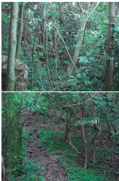
図2. 各調査地点の環境. 上, ブナ林 (1000 m); 下, 照葉樹二次林 (700 m).

調査は、ブナ林、照葉樹二次林とも山頂へと続く九州自然歩道沿いの少し林内に入った場所で