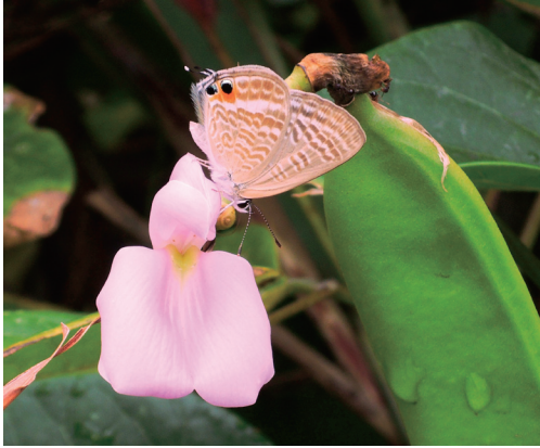
図4. ハマナタマメを訪れるウラナミシジミ。