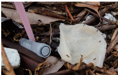
図8. B5のベイトと誘引されたアリ.