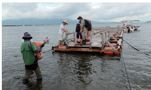
図9. 満潮時の弁天島浮き棧橋.