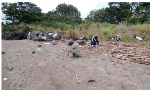
図7. 海岸線と垂直に引いたライン (B1-B5).