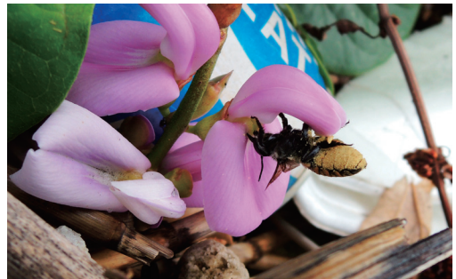
図5. ハマナタマメを吸蜜するキバラハキリバチ。