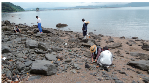
図6. 岩場のライン (C1-C5) の環境.