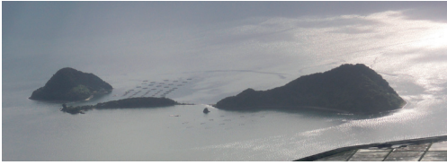
図1. 神造島（左から沖小島，弁天島，辺田小島）。