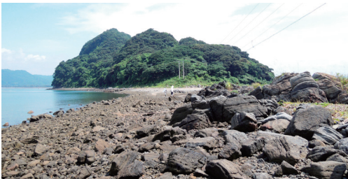
図2. 弁天島から辺田小島を望む。干潮時には州が島をつなぐので，歩いて渡れる。

10:20 隼人漁港出発～10:35 弁天島到着～辺田小島に渡島（図2）～12:00 まで辺田小島の海岸線を調査～弁天島に移動・昼食～13:30 から14:30 まで海岸線でのアリ調査～15:10 辺田小島出発～15:30 隼人漁港着。