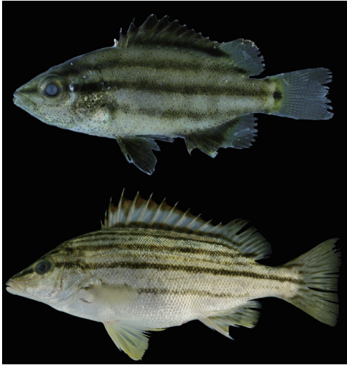
Fig. 14. Fresh specimens of Rhynchopelates oxyrhynchus from Kagoshima Prefecture (upper: KAUM-I. 6221, 16.5 mm SL; lower: KAUM-I. 10932, 151.4 mm SL).