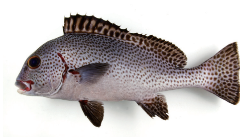
Fig. 10. Fresh specimen of Plectorhinchus picus from Kagoshima Prefecture (KAUM-I. 29625, 284.7 mm SL).

分布 アフリカ東岸からポリネシア, オーストラリアから南日本までのインド・太平洋に広く分布する (McKay, 2001). 国内では八丈島 (Senou et al., 2002), 小笠原, 南日本に分布 (島田, 2000; 財団法人鹿児島市水族館公社, 2008). 鹿児島県内では標本に基づき大隅諸島から確認された (本研究).