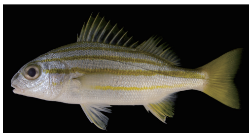
Fig. 13. Fresh specimen of Pomadasys quadrilineatus from Kagoshima Prefecture (KAUM-I. 25047, 104.3 mm SL).

備考 松沼ほか (2009) は, 本種 24 個体を鹿児島県各地から報告し, 種子島と屋久島沿岸で本種が再生産している可能性を示唆した.