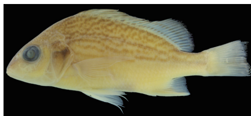
Fig. 12. Preserved specimen of Pomadasys argenteus from Kagoshima Prefecture (KAUM-I. 1783, 103.6 mm SL).

分布 紅海からオーストラリア, 南日本にかけてのインド・西太平洋に分布する (McKay, 2001). 国内では, 高知県 (島田, 2000), 奄美大島 (四宮・池, 1992), 琉球列島 (吉野ほか, 1975; 島田, 2000), 八丈島 (Senou et al., 2002) などに分布する. 鹿児島県内では標本に基づき奄美群島から確認された (本研究).