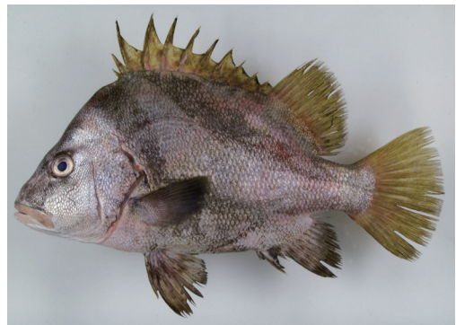
Fig. 3. Fresh specimen of Hapalogenys nigripinnis from Kagoshima Prefecture (KAUM-I. 30800, 235.4 mm SL).

備考 本種の学名は長らく Hapalogenys nitens Richardson, 1844 とされてきたが, Hapalogenys nigripinnis (Temminck & Schlegel, 1843) が古参異名であることが明らかとなった (Iwatsuki and Nakabo, 2005)。