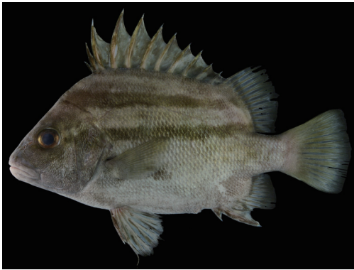
Fig. 2. Fresh specimen of Hapalogenys kishinouyei from Kagoshima Prefecture (KAUM-I. 10166, 200.1 mm SL).

分布 オーストラリア北西部、フィリピン、台湾、韓国南部から知られる (McKay, 2001)。国内では南日本に分布する (島田, 2000)。鹿児島県内では標本に基づき薩摩半島西岸、鹿児島湾、大隅半島東岸および大隅諸島から確認された (本研究)。