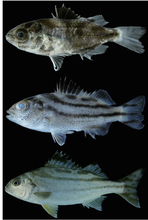
Fig. 15. Life stages of Terapon jarbua from Kagoshima Prefecture. Upper to lower: KAUM-I. 4374, 11.5 mm SL; KAUM-I. 4887, 21.5 mm SL; KAUM-I. 6166, 254.2 mm SL.