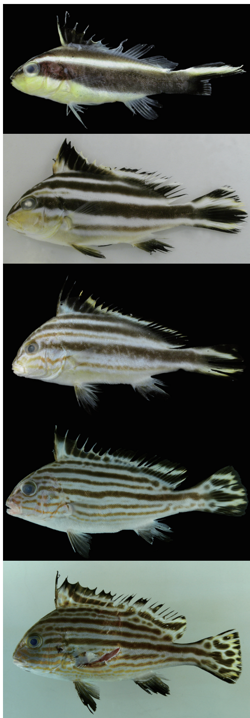
Fig. 1. Life stages of Diagramma pictum pictum from Kagoshima Prefecture. Upper to lower: KAUM-I. 409, 31.3 mm SL; KAUM-I. 977, 68.5 mm SL; KAUM-I. 945, 83.0 mm SL; KAUM-I. 6899, 95.0 mm SL; KAUM-I. 7459, 125.6 mm SL.