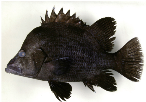
Fig. 4. Fresh specimen of Hapalogenys sennin from Kagoshima Prefecture (KAUM-I. 22395, 208.6 mm SL).

備考 ヒゲダイの学名は長らく Hapalogenys nigripinnis (Temminck & Schlegel, 1843) とされてきたが, H. nigripinnis はヒゲソリダイに適用すべき学名であることが明らかになった. Iwatsuki and Nakabo (2005) により, ヒゲダイは未記載種であることが明らかになり, Hapalogenys sennin Iwatsuki & Nakabo, 2005 として新種記載された.