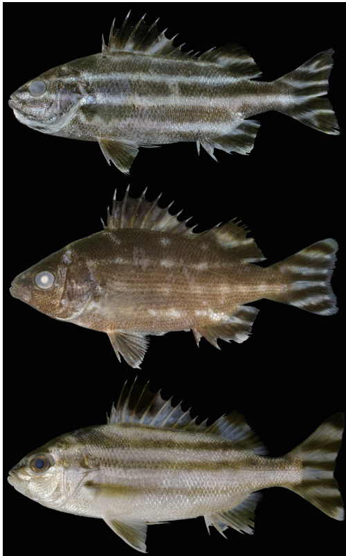
Fig. 16. Life stages of Terapon theraps from Kagoshima Prefecture. Upper to lower: KAUM-I. 10129, 49.6 mm SL; KAUM-I. 1580, 82.6 mm SL; KAUM-I. 20845, 146.5 mm SL.

分布 紅海, アフリカ東岸からソロモン諸島, 南日本にかけて広く分布する (瀬能, 2000; Vari, 2001). 鹿児島県内では標本に基づき鹿児島湾, 薩摩半島西岸および大隅半島東岸から確認された (本研究).