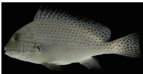
Fig. 1. Continued. KAUM-I. 2895, 216.0 mm SL.

記載 背鰭条数 IX-X, 21-23; 臀鰭条数 III, 6-8; 胸鰭条数 16-17; 腹鰭条数 I, 5; 側線有孔鱗数 64-72; 側線上方の横列鱗数 20-26; 側線下方の横列鱗数 28-32; 背鰭前方鱗数 75-85; 尾柄周鱗数 31-34; 総鰓耙数 6-8+13-16=19-23. 下顎腹面にひげがない. 背鰭起部に前向棘がない. 下顎正中線に縦長の溝がない. 眼の下縁は吻端より上方. 背鰭棘数は 10 以下.