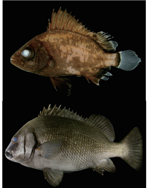
Fig. 8. Fresh specimens of Plectorhinchus gibbosus from Kagoshima Prefecture (upper: KAUM-I. 6235, 24.1 mm SL; lower: KAUM-I. 21089, 394.4 mm SL).

備考 松沼ほか (2009) は, 薩摩半島西岸, 大隅半島東岸, 種子島および奄美大島から本種計 5 個体を報告し, コシウダイ Plectorhinchus cinctus (Temminck & Schlegel, 1843) との比較を行った。その中で本種の側線上方鱗数を 9–11 としたが, 本研究において, 本種の側線上方鱗数は 9–14 であり, 松沼ほか (2009) の報告したものよりも変異に富むことが明らかとなった。また, 松沼ほか (2009) は本種の側線下方鱗数を 15–17, コシウダイの下方鱗数を 20–22 としたが, 本研究の調査の結果, 本種の側線下方鱗数は 15–20, コシウダイの側線下方鱗数は 20–25 であった。