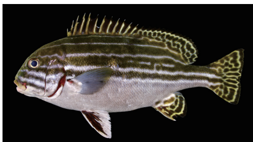
Fig. 9. Fresh specimen of Plectorhinchus lessonii from Kagoshima Prefecture (KAUM-I. 37915, 308.5 mm SL).