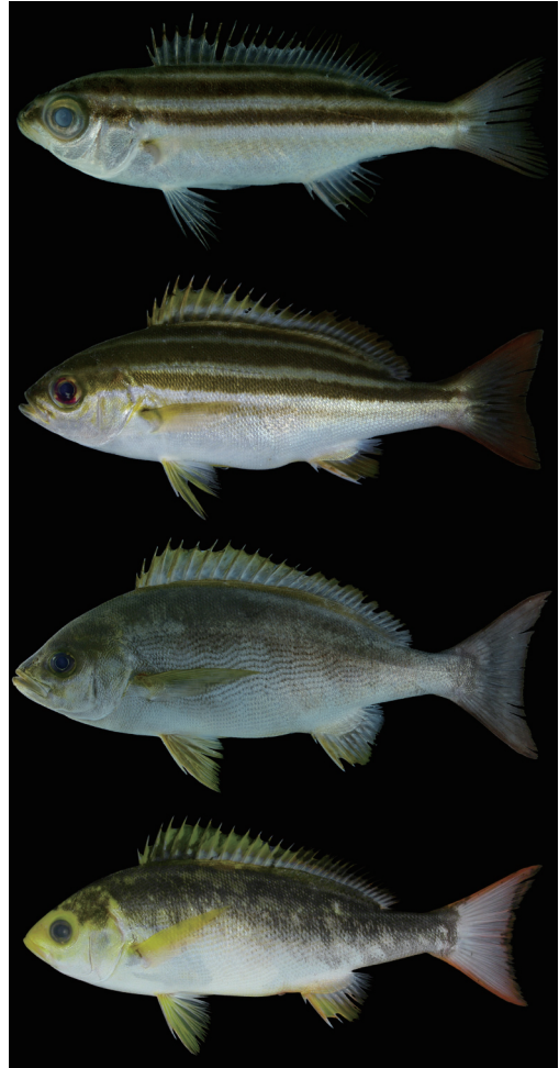
Fig. 5. Life stages of Parapristipoma trilineatum from Kagoshima Prefecture. Upper to lower: KAUM-I. 5929, 47.9 mm SL; KAUM-I. 23750, 112.5 mm SL; KAUM-I. 5962, 291.5 mm SL; KAUM-I. 1263, 201.9 mm SL (color variation).

標本 15 個体 (体長 8.8–300.6 mm)：KAUM-I. 2296, 体長 8.8 mm, 日置市吹上町永吉川河口, 2001 年から 2002 年にかけて；KAUM-I. 2316, 体長 29.8 mm, 日置市吹上町永吉川, 2011 年 6 月 27 日から 28 日にかけて；KAUM-I. 2893, 体長 184.0 mm, 南さつま市笠沙町片浦崎ノ山東側 (31°25'44"N, 130°11'49"E), 水深 27 m, 2006 年 10 月 28 日, 定置網, 伊東正英；KAUM-I. 4881, 体長 36.2 mm, KAUM-I. 4882, 体長 38.3 mm, KAUM-I. 4883, 体長 42.7 mm, KAUM-I. 4884, 体長 45.2 mm, KAUM-I. 4885, 体長 38.1 mm, 出水郡長島町蔵之元小浜小浜川 (32°10'09"N, 130°06'38"E), 水深 0.3–1.5 m, 2007 年 7 月 21 日, タモ網, 松沼瑞樹；KAUM-I. 4906, 体長 31.0 mm, 阿久根市浜町高松川河口 (31°01'09"N, 130°11'31"E), 水深 1.0 m, 2007 年 7 月 22 日, タモ網, 松沼瑞樹；KAUM-I. 4916, 体長 33.3 mm, 出水郡長島町下山門野沙見川河口 (32°06'31"N, 130°08'33"E), 水深 0.5 m, 2007 年 7 月 24 日, タモ網, 松沼瑞樹；KAUM-I. 4924, 体長 42.3 mm, 阿久根市脇本新田川下流 (31°05'04"N, 130°12'07"E), 水深 0.5 m, 2007 年 7 月