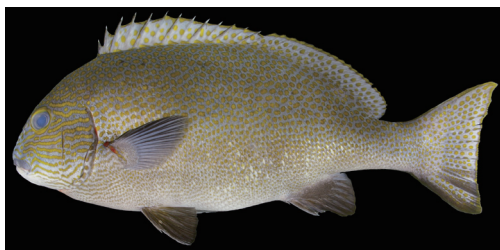
Fig. 7. Fresh specimen of Plectorhinchus flavomaculatus from Kagoshima Prefecture (KAUM-I. 17744, 386.0 mm SL).

分布 紅海を含むインド・西太平洋に広く分布 (McKay, 2001)。国内では紀伊半島以南，八丈島，小笠原に分布（島田, 2000）。鹿児島県内では標本に基づき薩摩半島西岸から確認された（本研究）。