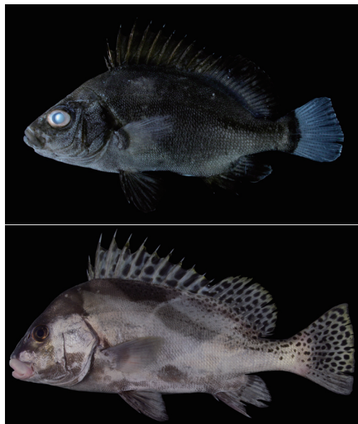
Fig. 6. Fresh specimens of Plectorhinchus cinctus from Kagoshima Prefecture (upper: KAUM-I. 4881, 36.2 mm SL; lower: KAUM-I. 33796, 300.6 mm SL).

備考 松沼ほか（2009）は本種 15 個体を鹿児島県から報告し，クロコシヨウダイ Plectorhinchus gibbosus (Lacepède, 1802) との比較を行った。その中で本種の側線上方鱗数を 15–18 としたが，本研究において，本種の側線上方鱗数は 15–20 であり，松沼ほか（2009）が報告したものよりも変異に富むことが明らかとなった。また，松沼ほか（2009）は本種の側線下方鱗数を 20–22，クロコシヨウダイの下方鱗数を 15–17 とし，両種を識別できるとしたが，本研究において，本種の側線下方鱗数は 20–25，クロコシヨウダイの側線下方鱗数は 15–20 であることが分かった。