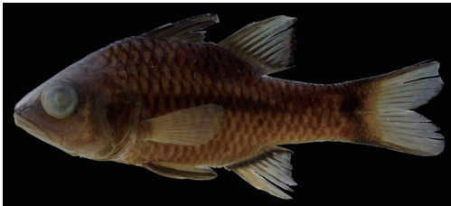
Fig. 2. Preserved specimen of Apogon kallopterus . CMNH-ZF 15647, 82.8 mm SL, Isso, Yaku-shima Island, Kagoshima, southern Japan.

カスリイシモチの屋久島における記録は水中写真に基づくもののみ (Yoshida et al., 2010: fig. 15) であったため, 本報告は標本に基づく本種の屋久島初記録である。