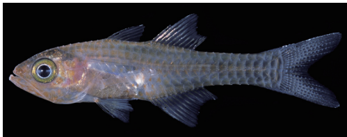
Fig. 5. Fresh specimen of Cercamia eremia . CMNH-ZF 13908, 25.1 mm SL, Yudomari, Yaku-shima Island, Kagoshima, southern Japan.

備考 本種はインド・西部太平洋に広く分布する (Allen et al., 2005)．日本では八丈島 (Senou et al., 2002)，静岡県 (Hayashi, 1991)，和歌山県 (Hayashi, 1991)，徳島県 (藍澤・瀬能, 1991；Hayashi, 1991)，屋久島 (本研究)，奄美大島 (Hayashi, 1991)，瀬底島 (Hayashi, 1991)，沖繩島 (吉郷ほか, 2001)，伊江島 (Senou et al., 2006)，宮古島 (Senou et al., 2007) および西表島 (Hayashi, 1991) から報告されている．