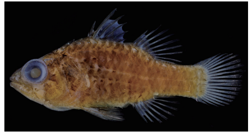
Fig. 6. Preserved specimen of Fowleria vaiulae . CMNH-ZF 13816, 36.7 mm SL, Isso, Yaku-shima Island, Kagoshima, southern Japan.

本研究では Gon and Randall (2003) に従い，シボリダマシの学名を Fowleria vaiulae とした．