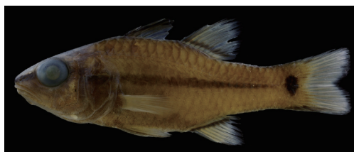
Fig. 1. Preserved specimen of Apogon fraenatus . CMNH-ZF 14262, 88.1 mm SL, Isso, Yaku-shima Island, Kagoshima, southern Japan.

ヒトスジイシモチの屋久島における記録は水中写真に基づくもののみ (Yoshida et al., 2010: figs. 13A-B) であったため, 本報告は標本に基づく本種の屋久島初記録である.