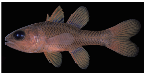
Fig. 3. Fresh specimen of Apogon unicolor . CMNH-ZF 13982, 43.7 mm SL, Isso, Yaku-shima Island, Kagoshima, southern Japan.