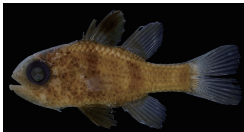
Fig. 4. Preserved specimen of Apogonichthyoides cf umbratilis . CMNH-ZF 13824, 21.4 mm SL, Isso, Yaku-shima Island, Kagoshima, southern Japan.

日本における本種の分類学的研究は横須賀市 自然・人文博物館の林 公義氏によって行われて いる。